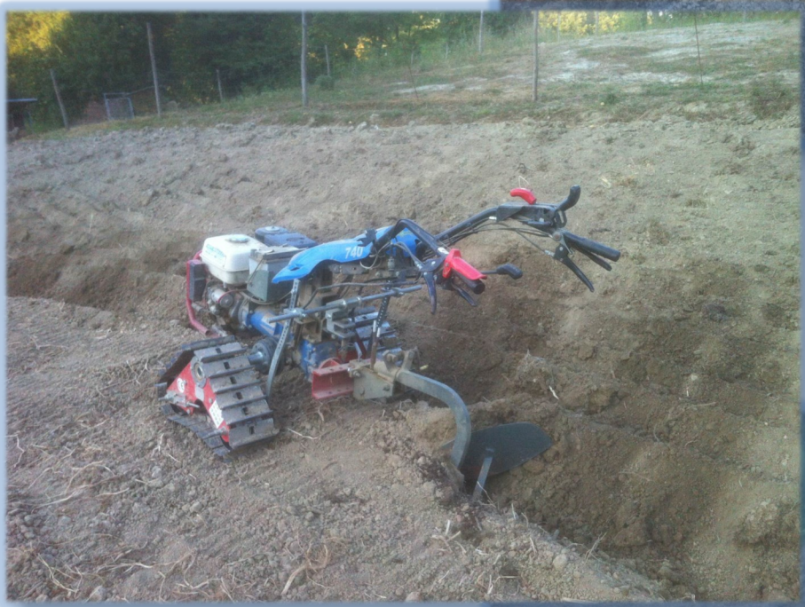
BCS 740 con aratro voltaorecchio