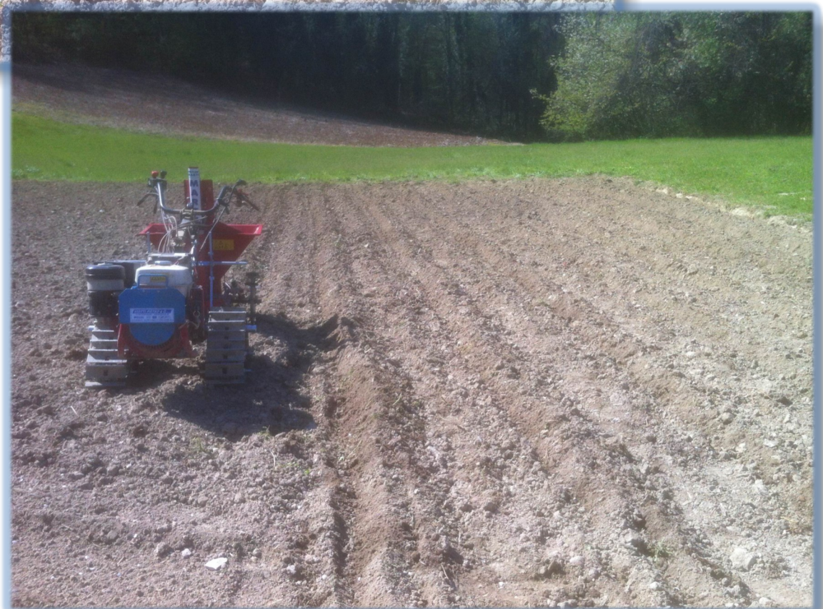
BCS 740 con seminapatate Marte