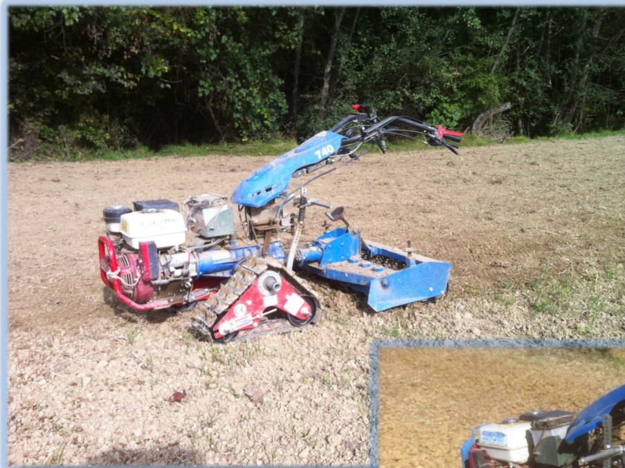
BCS 740 con erpice rotante