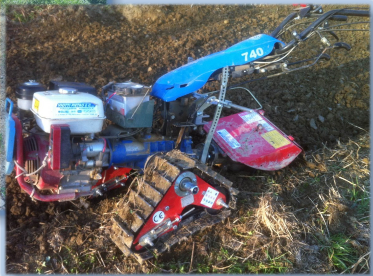
BCS 740 con aratro rotativo Berta