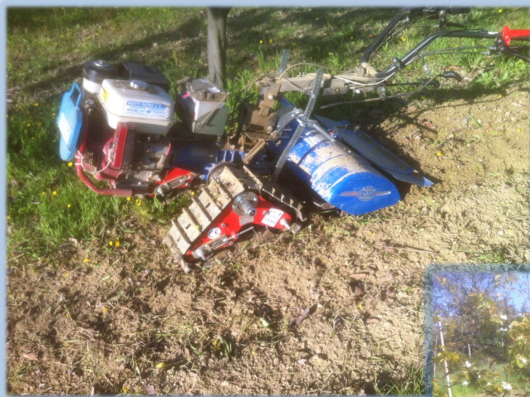
BCS 740 con fresa terra