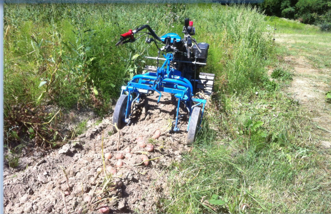
BCS 740 con scavapatate