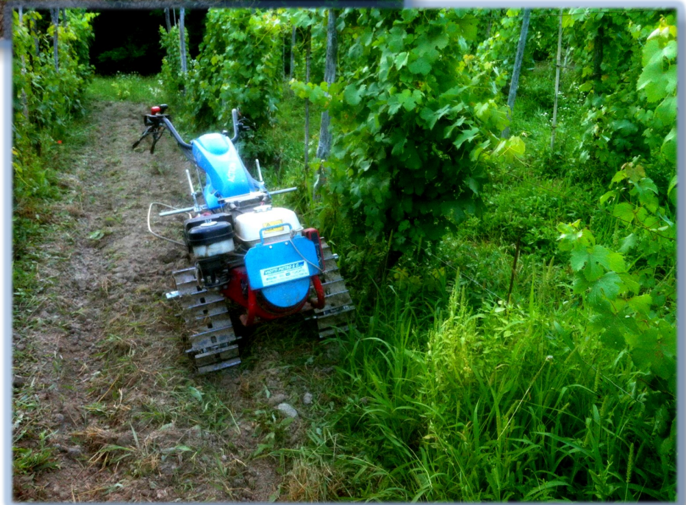
BCS 740 con aratro rotativo Berta