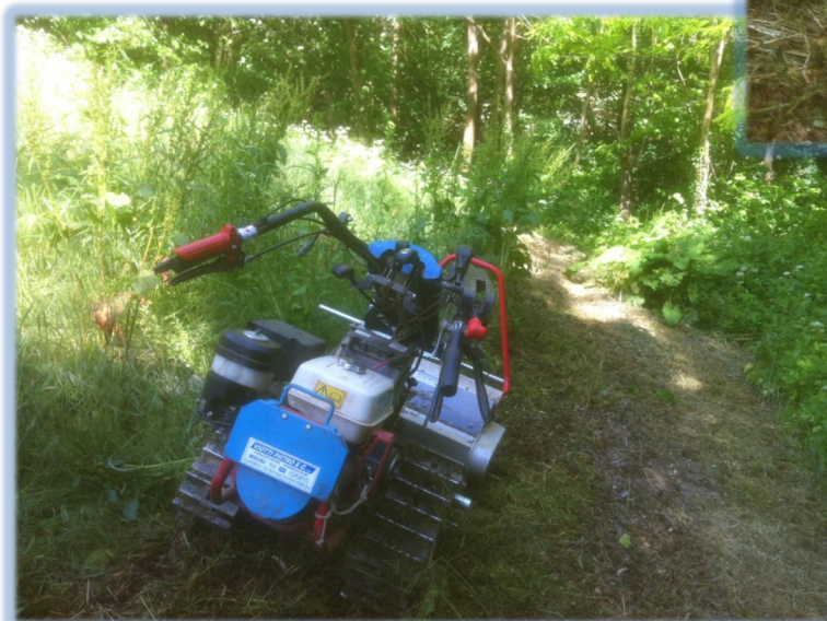
BCS 740 con trincia Berta